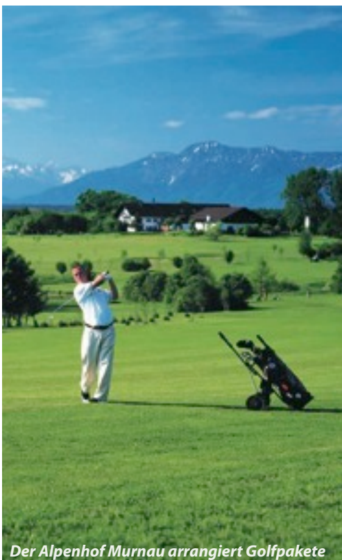
Der Alpenhof Murnau arrangiert Golfpakete

info@zugspitz-region.de www.zugspitz-region.de