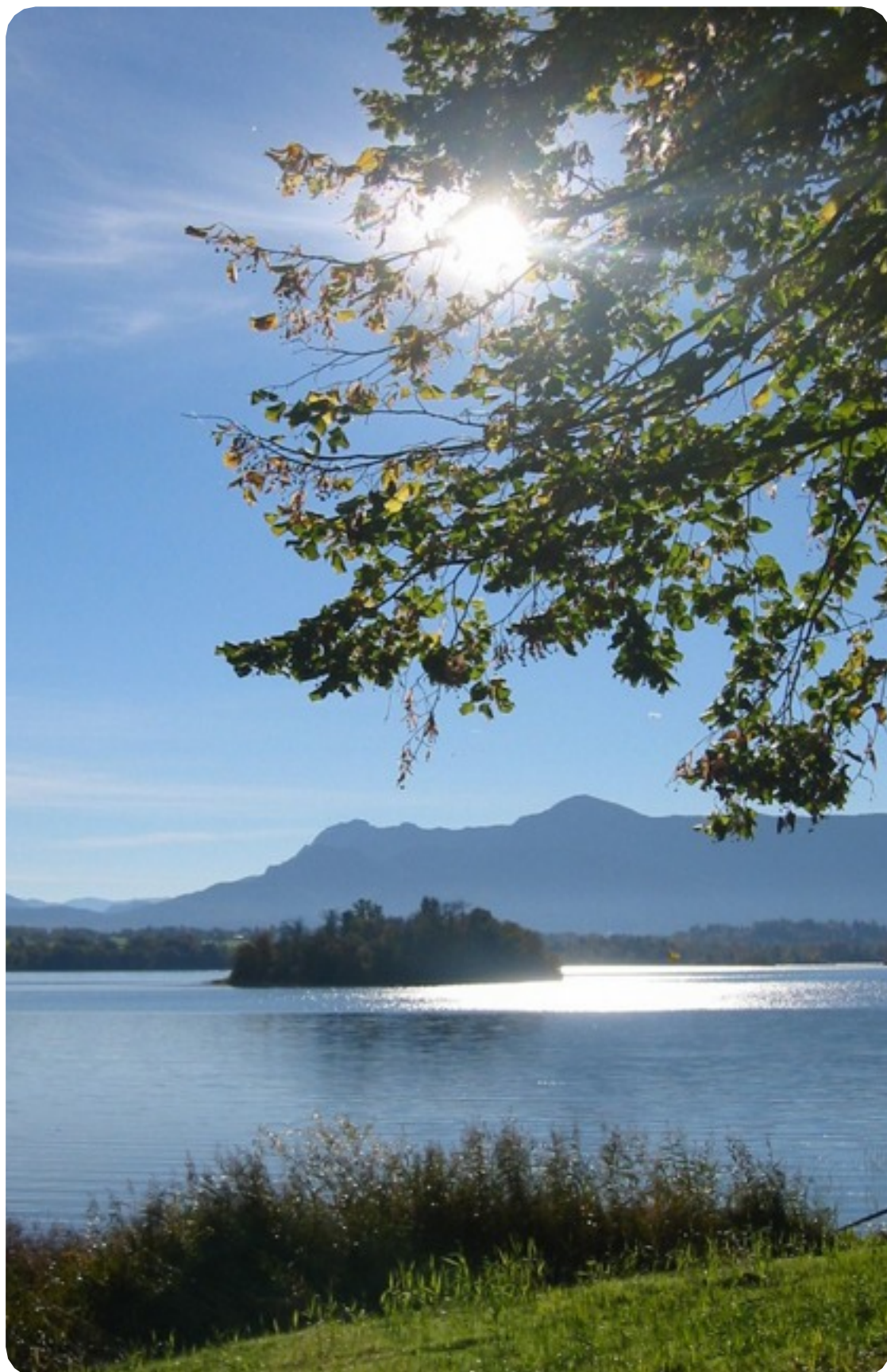
Insel im Staffelsee