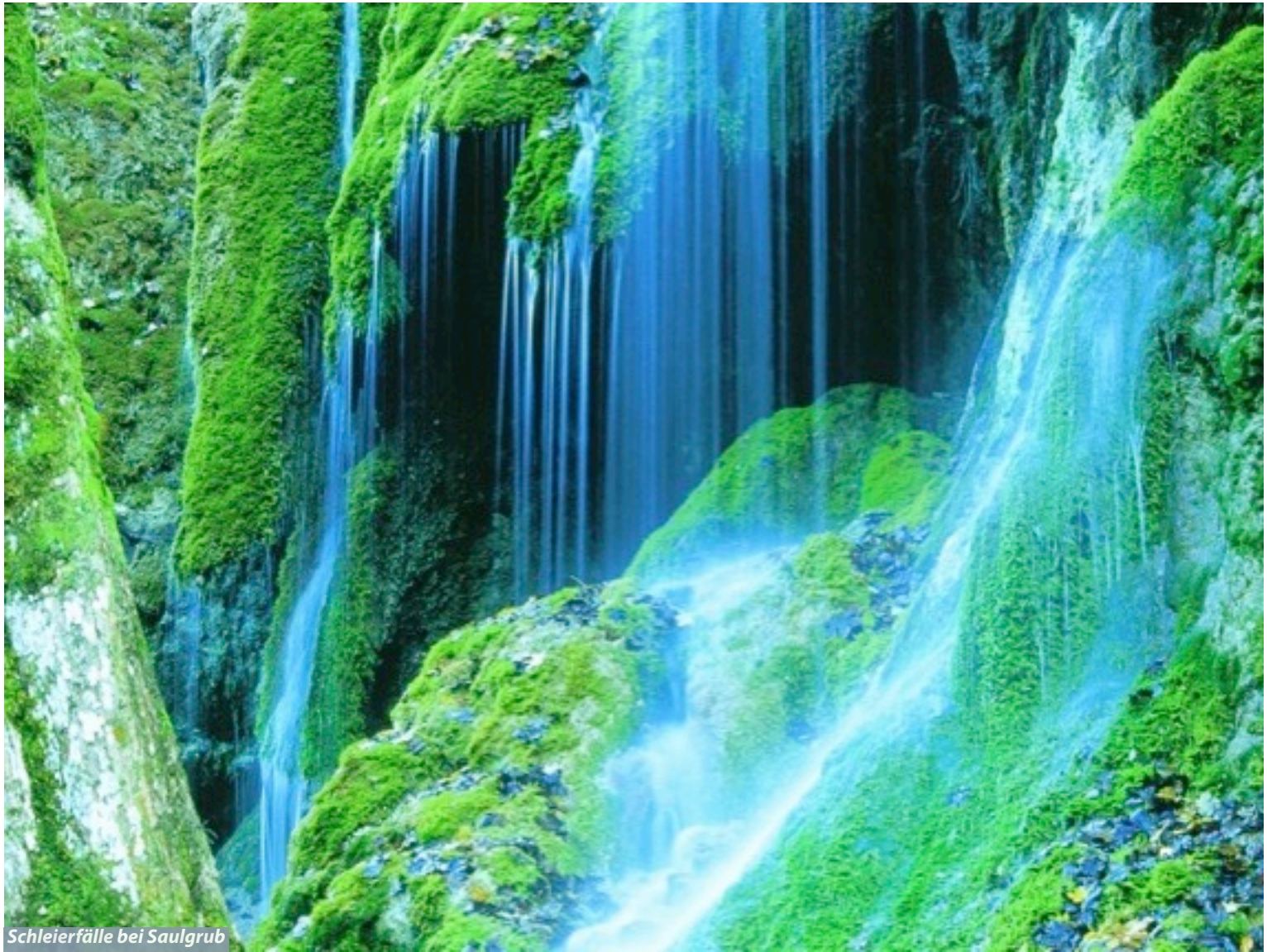
Schleierfälle bei Saulgrub