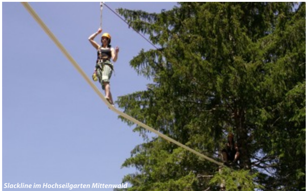
Slackline im Hochseilgarten Mittenwald

Angeln, Barfuß-Parcours, Beachvolleyball, Bergsteigen, Golf (18-Loch-Platz in Oberau, 9-Loch-Platz in Wallgau), Gleitschirmfliegen, Kanufahren, Nordic Walking, Paragliding, Rafting, Reiten, Rudern, Schaukäserei Ettal, Segeln, Sommerstockbahn, Surfen, Tennis, Spielbank Garmisch-Partenkirchen