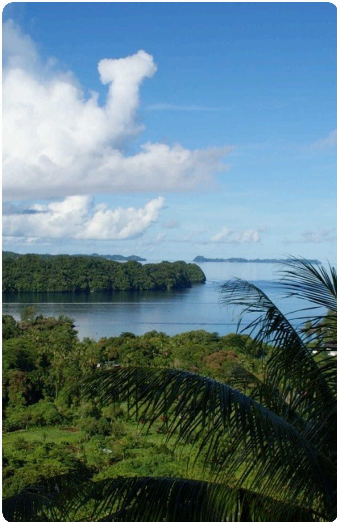
Blick auf die Rock Islands, Naturschutzgebiet