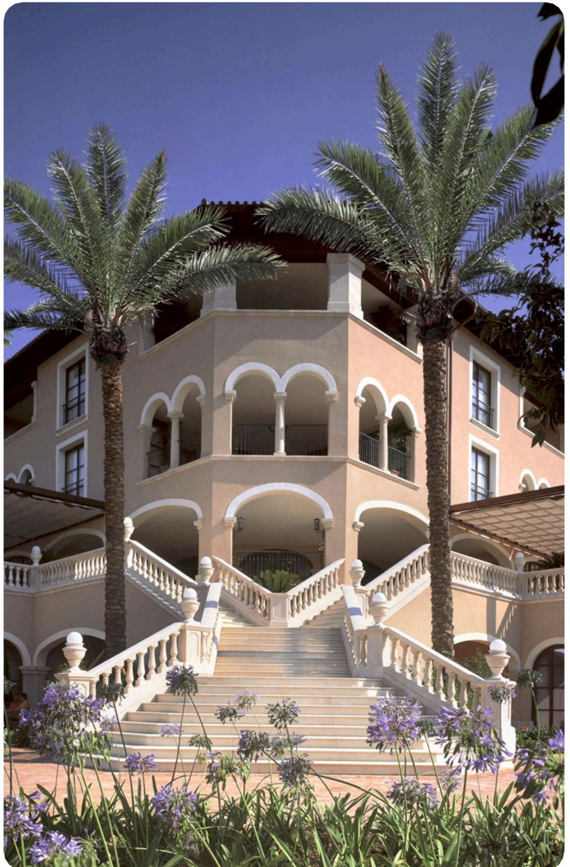
Das St. Regis Mardavall ist im mediterranen Stil erbaut